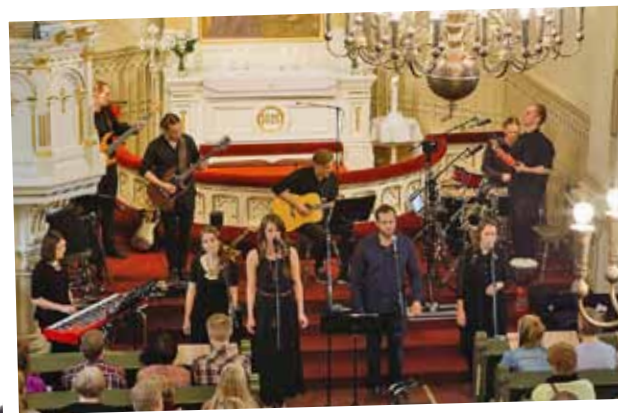
Yläkaupungin yö -tapahtuman yhteydessä toteutettu konsertti houkutteli kirkon täydeltä musiikinystävää.