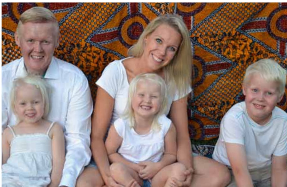
Kurkkaus kentälle -sarjassa tutustutaan seurakunnan läheteihin ympäri maailman. Ensimmäisenä vuorossa ovat Mesiäislehdot, jotka palvelevat Tansaniassa.